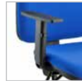
B13 - Braccioli opzionali regolabili in nylon nero B13 - Optional adjustable armrests in black nylon