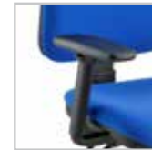
B14 - Braccioli opzionali regolabili in nylon nero 4D con pad in poliuretano nero B14 - Optional adjustable 4D armrests in black nylon with black polyurethane pad