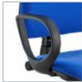
B10 - Braccioli opzionali in nylon nero B10 - Optional armrests in black nylon