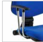
B12 - Braccioli opzionali in acciaio cromato con pad in nylon nero B12 - Optional armrests in chromed steel with black nylon pad