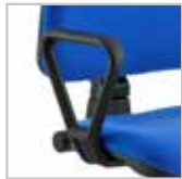
B11 - Braccioli opzionali in poliuretano con anima in acciaio B11 - Optional armrests in polyurethane with steel core