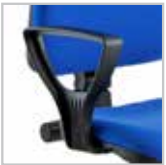
B00 - Braccioli di serie in nylon nero B00 - Series armrests in black nylon

Managerial and visitor chairs manufactured to European standards in accordance to environmental and ergonomic regulations, all of the materials used are separable and recyclable. INNER SEAT in anatomically shaped multilayered wood. INNER BACKREST in reinforced nylon with lumbar support. FOOTREST made of chromed metal and black nylon, adjustable (Stools). PADDING in polyurethane resin with diversified density. Uni 9175 Classe 11M fire retardant padding upon request. UPHOLSTERY choices among our colour chart or supplied by the customer (Mtl x h 1,40 needed 0,70). CUSTOM-TAILORING for logo sewing, brand implementation or other workmanship.